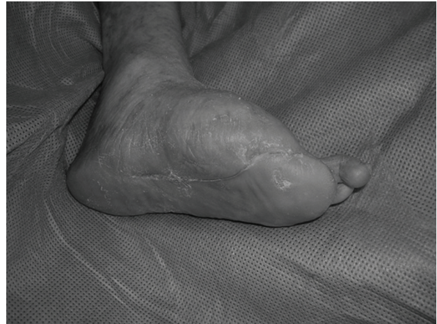
Figura 5 - Aspecto do pé esquerdo da paciente após epitelização da ferida

O tratamento de feridas complexas no pé diabético constitui grande desafio ao cirurgião vascular. A evolução apresentada pela paciente corrobora as elevadas taxas de salvamento de membro em séries de angioplastia subintimal 9-11 .