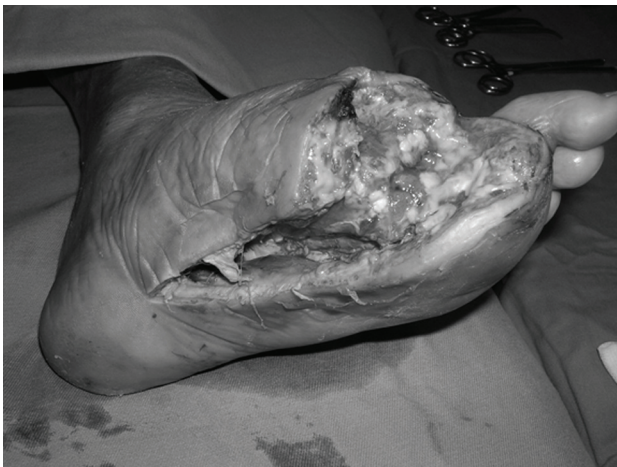
Figura 4 - Pé esquerdo após desbridamento do tecido desvitalizado

então paulatinamente aproximados, até que se obteve a tão esperada epitelização (Figura 5).