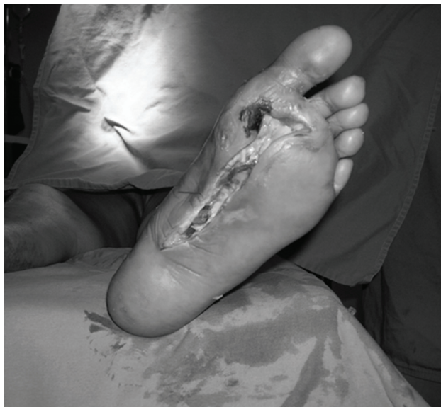
Figura 1 - Pé esquerdo após drenagem do abscesso plantar

melito, insuficiência cardíaca, coronariopatia e síndrome isquêmica dos membros inferiores, evoluiu com sinais flogísticos no pé esquerdo associados a dor e febre. Ao ser admitida na emergência, identificou-se a presença de volumoso abscesso plantar. A avaliação realizada pela equipe clínica determinou o risco cirúrgico como IV conforme a American Society of Anesthesiology (ASA IV). Ao exame físico, a paciente apresentava hiperemia do pé associada a volumosa massa plantar com flutuação, além de linfangite, que se estendia até o terço distal da coxa, com pulsos femorais palpáveis, poplíteos e distais ausentes. Duplex scan arterial colorido evidenciou a presença de oclusão crônica segmentar da artéria femoral superficial nos terços médio e distal.