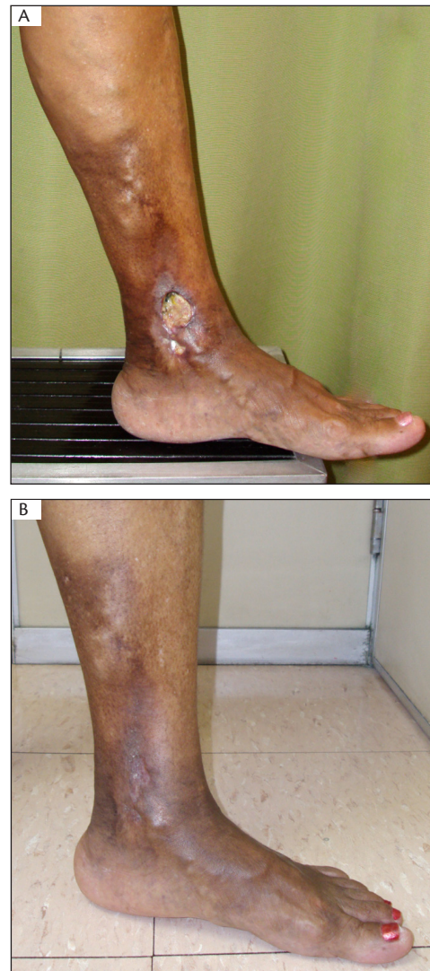
Figura 1. Paciente do sexo feminino com úlcera em face medial de perna esquerda há seis anos, com insuficiência de veia safena magna em toda sua extensão. (A) antes e (B) 30 dias após o tratamento.

Setenta membros foram tratados com injeção da espuma em safena magna e seis membros em veia safena parva. O sucesso técnico imediato (oclusão das veias tratadas) foi de 100%. O número de sessões necessárias para o sucesso técnico variou de um a quatro, e a maior parte dos tratamentos realizados foi concluída com apenas uma sessão; em dois casos, foram necessárias quatro sessões, com uma média de 1,58 sessão/membro