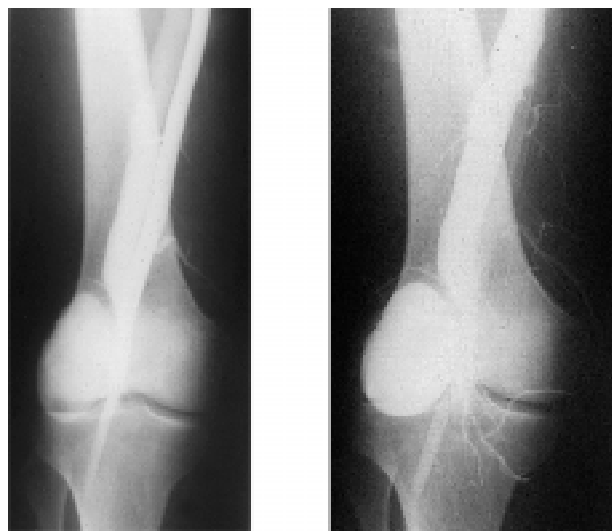
Figura 3 - Arteriografia femoral evidenciando a fístula arteriovenosa entre a artéria e a veia poplíteia esquerda.

Por se tratar de um caso sui generis na época (1971), e caracterizando um verdadeiro desafio terapêutico, antes de indicar a correção cirúrgica da FAV dos vasos poplíteos, os responsáveis pelo caso clínico reuniram, em “Conferência Médica”, cirurgiões vasculares, cardíacos e de tórax para que se definisse a indicação do tratamento a ser instituído para a presença do corpo estranho (PAF) no interior do ramo da artéria pulmonar esquerda. Foram debatidos os prós e os contras de