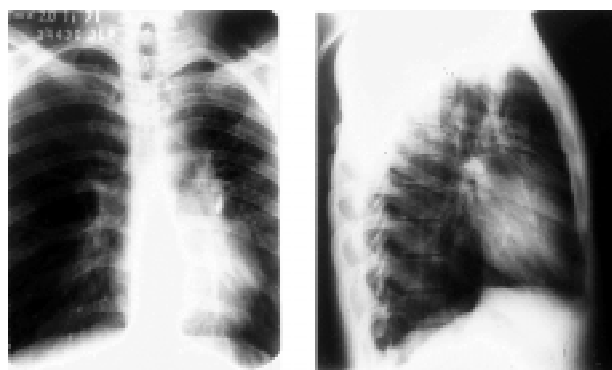
Figura 1 - Radiografia de tórax em pósterio-anterior e perfil demonstrando a presença de fragmento metálico no hilo pulmonar.

No exame de avaliação pré-operatória, a radiografia do tórax em posição ântero-posterior e em perfil revelou, de forma surpreendente, a presença de um corpo estranho radiopaco, de provável natureza metálica, na área pulmonar esquerda (Figura 1).