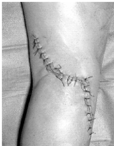
Figura 4 - Via de acesso utilizada para a correção cirúrgica da fistula arterio-venosa.

Em 1987, portanto 15 anos depois do trauma, com a finalidade de avaliar a evolução do caso, foi realizada radiografia simples de tórax em pósterio-anterior (PA) e