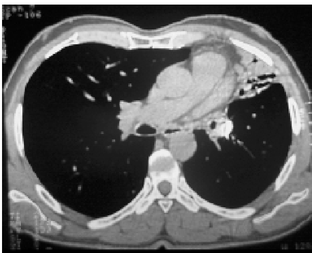
Figura 5 - Angiotomografia de tórax demonstrando o fragmento metálico na mesma situação inicial e artéria pulmonar sem trombose.